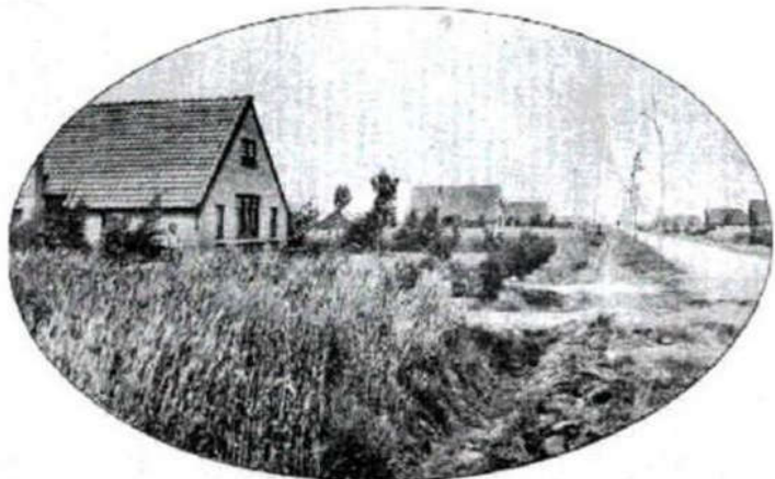
De eerste huizen langs een kale straat in Witteveen.

H et waren kerels mit voesten; mit eelt in de knoesten; in bever en baat; maor pezig en taat; die uut de wildernis een neie wereld schiepen.