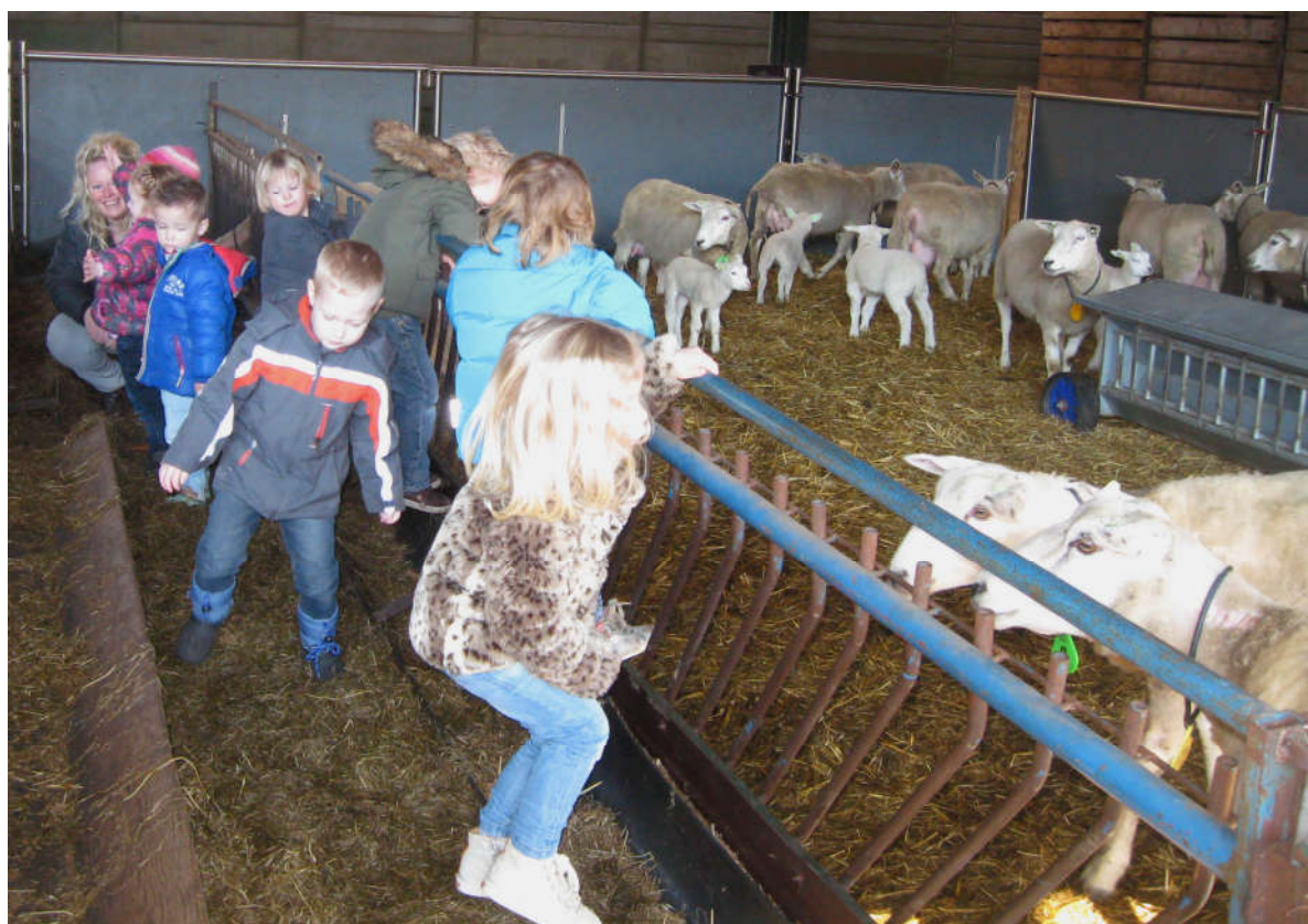
PEUTERS OP EXCURSIE NAAR MANTINGE