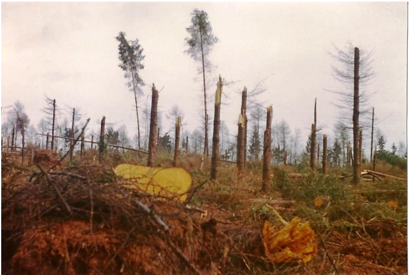
Witteveense bos 13 november 1972